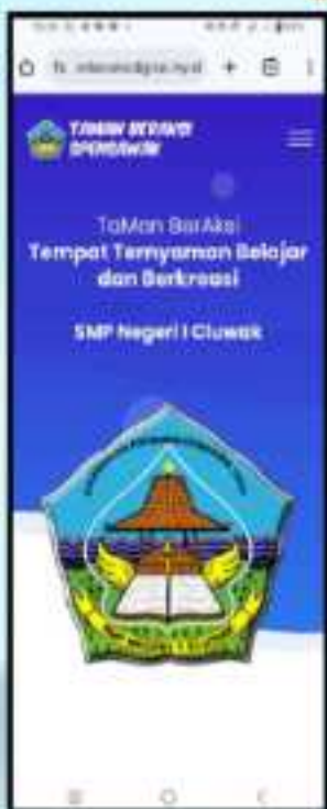
• Tampilan Beranda Via Mobile

Pada laman beranda, Anda dapat mengakses beberapa informasi yaitu menu home, Karya Literasi, Karya Numerasi, Materi Literasi, Materi Numerasi, Ayo Berlatih, Pedoman Teknis, Pengaduan, dan Login.