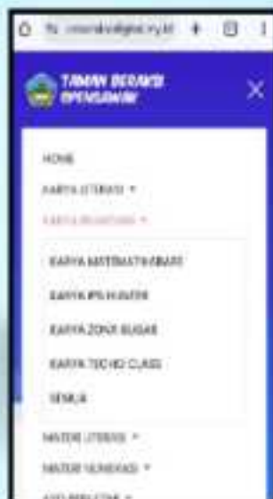
• Tampilan menu "Karya Numerasi" - -- Karya Matematikabare via Mobile