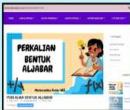
Tampilan menu "Materi Numerasi" via PC

Setelah siswa mengklik salah satu kategori maka akan muncul materi dari kategori tersebut. Siswa tinggal klik baca selengkapnya untuk mengetahui isi materi secara keseluruhan. Siswa juga dapat ikut berpartisipasi untuk mengirimkan materi. Klik "Kirim Karya" dan melengkapi data. Langkahnya sama saat mengirim soal pada menu "Ayo Berlatih"