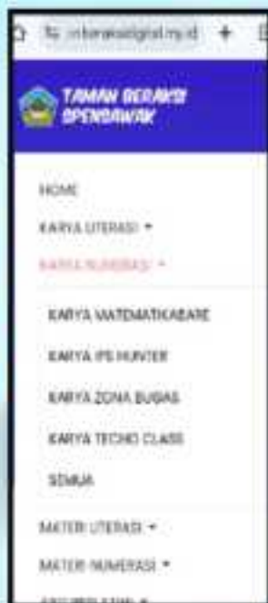
Tampilan Menu "Materi Numerasi" -- Matematikabare via Mobile