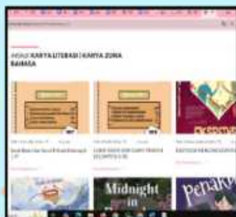
• Tampilan menu "Karya Literasi" via PC

Setelah siswa mengklik salah satu kategori maka akan muncul karya siswa dari kategori tersebut. Siswa tinggal klik baca selengkapnya untuk mengetahui isi karya secara keseluruhan.