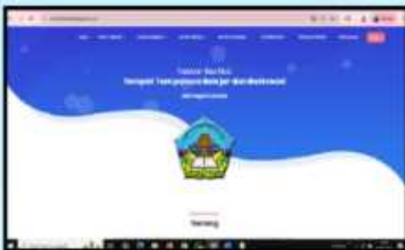
• Tampilan Beranda Via PC

Pada laman beranda, Anda dapat mengakses beberapa informasi yaitu menu home, Karya Literasi, Karya Numerasi, Materi Literasi, Materi Numerasi, Ayo Berlatih, Pedoman Teknis, Pengaduan, dan Login.