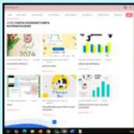
• Tampilan menu "Karya Numerasi" via PC

Setelah siswa mengklik salah satu kategori maka akan muncul karya siswa dari kategori tersebut. Siswa tinggal klik baca selengkapnya untuk mengetahui isi karya secara keseluruhan.