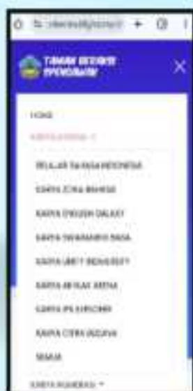
• Tampilan menu "Karya Literasi" -- Karya Zona Bahasa via Mobile